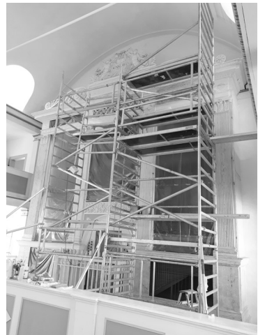
Restaurierung des Prospektes 2020

ORGELFÖRDERVEREIN ® COUDRAY-KIRCHE RASTENBERG eV